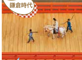
旧相模川橋脚復元模型

旧相模川橋脚は、源頼朝の重臣・稲毛重成が亡き妻の供養のために架けた橋とされています。その落成式に参列した頼朝は、帰路で馬から落下。ほどなく亡くなりました。関東大震災に伴う液状化現象を示す震災遺構でもあります。