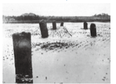
液状化現象で現れた旧相模川橋脚