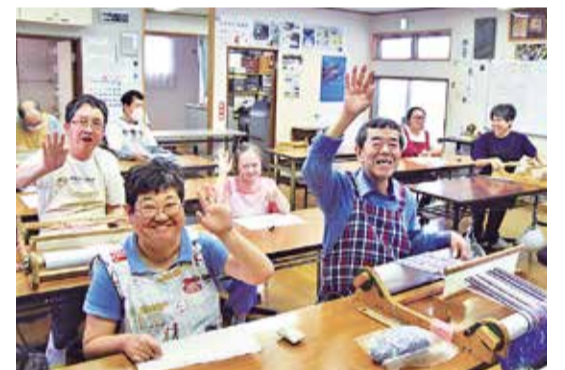
作業に専念しつつ、笑顔で迎えてくれた皆さん

誰もが暮らしやすい社会をつくるには、障がい者という先入観を持たず、互いに積極的に関わる気持ちが大切だと思います。日常のあいさつだけでも、十分気持ちは通じ合いますよ。