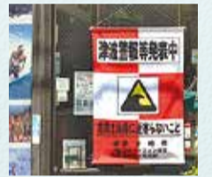
津波フラッグ(左)とタペストリー(右)