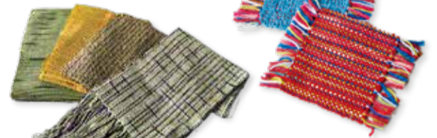
▲手織りの夏用マフラー(左)・コースター(右)