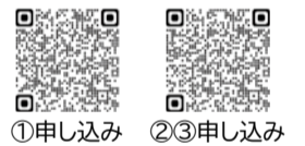
①申し込み ②③申し込み