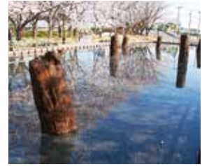
旧相模川橋脚(下町屋)

国史跡・天然記念物「旧相模川橋脚」は、関東大震災によって水田に橋杭が出現した全国的にもまれな遺跡です。現在は小出川沿いにありますが、かつて付近には「古相模川」という川が流れていました。展示では、古相模川にまつわる茅ヶ崎の歴史をひもときます。