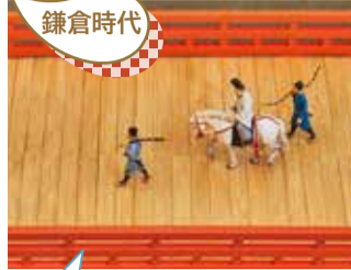
旧相模川橋脚復元模型

旧相模川橋脚は、源頼朝の重臣・稲毛重成が亡き妻の供養のために架けた橋とされています。その落成式に参列した頼朝は、帰路で馬から落下。ほどなく亡くなりました。関東大震災に伴う液状化現象を示す震災遺構でもあります。