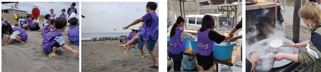
「宝探し」と「サンダル飛ばし」もにぎやか