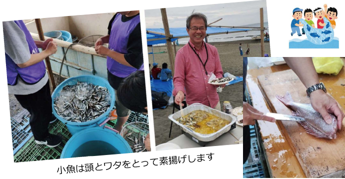
小魚は頭とワタをとって素揚げします