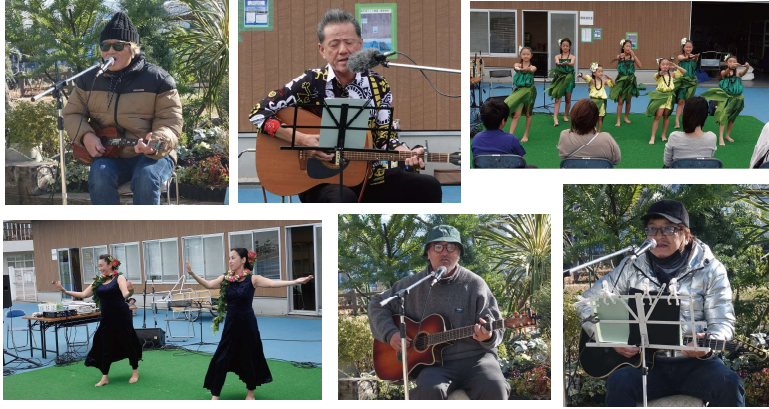
能登半島地震の義援金呼び掛けをきっかけに開始しました。