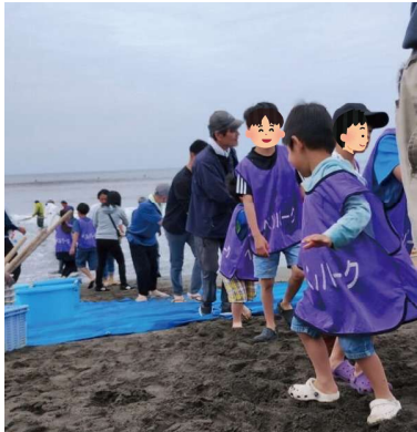
大漁を祈って網を引く手にも力はいります

令和7年5/24(土)、ベルパーク湘南茅ヶ崎自治会で、地引網を開催しました。今回参加されたのは約100名の方でした。