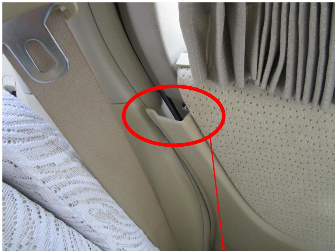
↑助手席側リアスライドドア内装外れ