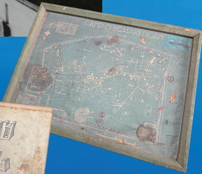
米軍接收時の南湖院の 地図パネル