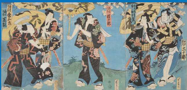
歌川芳鶴「青砥稿花紅彩画 白浪五人男」 1862(文久2)年