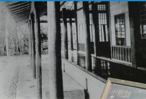
九代目市川團十郎の別荘「孤松庵」 (『舞台の市川團十郎』より引用)