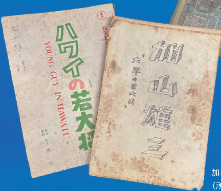
加山雄三出演映画台本