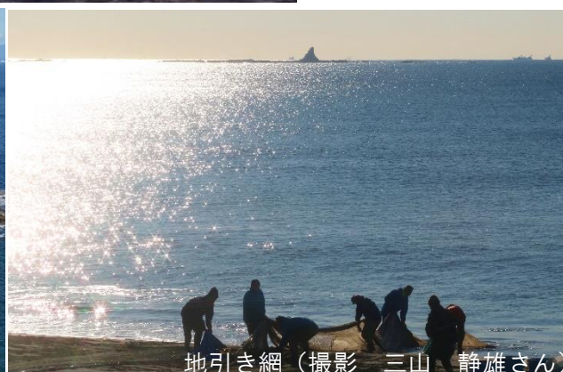
地引き網