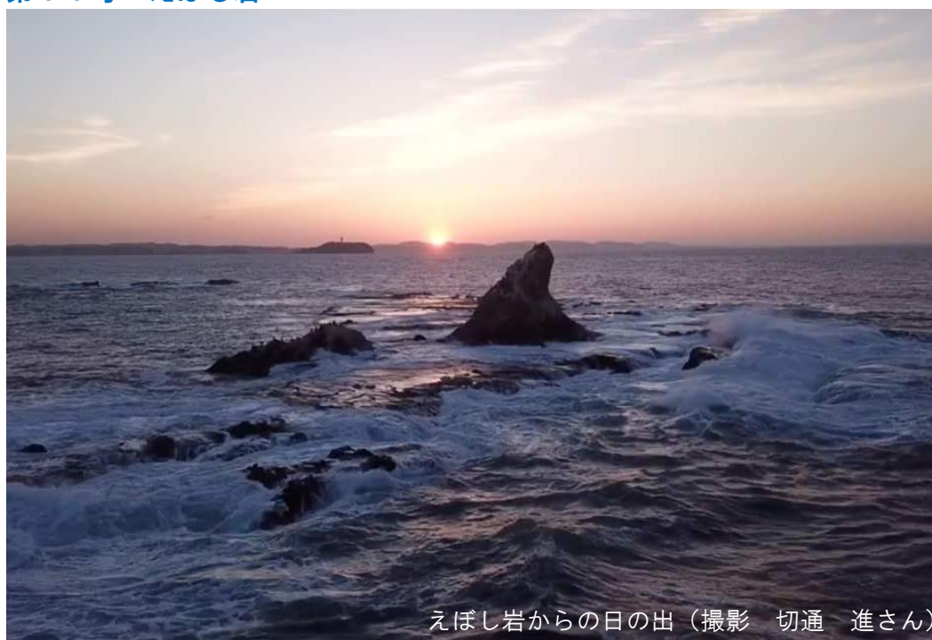
えぼし岩からの日の出