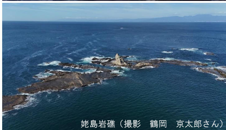
姥島岩礁

湘南の風景要素である 富士山や江の島などの 周辺風景との一体感に よって、茅ヶ崎のシンボ ルとして訪れる人々を 引き付ける魅力的な景 観を形成している。