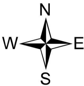
( 凡 例 )