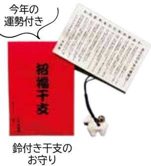
今年の運勢付き 鈴付き干支のお守り