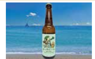
茅ヶ崎ビール 小松菜