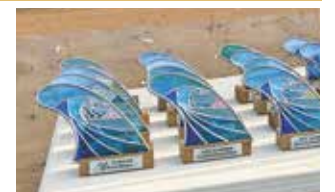
ステンドグラス体験教室

湘南茅ヶ崎クラフトフェア いちの市実行委員会 全国から総勢146店舗が集合 (8面に関連記事掲載)