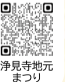
浄見寺地元まつり