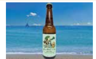
茅ヶ崎ビール 小松菜