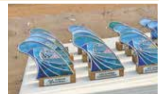
ステンドグラス体験教室

湘南茅ヶ崎クラフトフェア いちの市実行委員会 全国から総勢146店舗が集合 (8面に関連記事掲載)