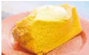
あたかもシュークリーム