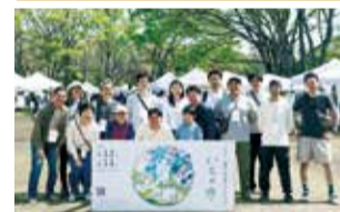
湘南茅ヶ崎クラフトフェア