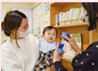
遊具や絵本の他、北口子育て支援センターはランチスペースも

市内4か所にある子育て支援センターは、妊娠中・子育て中の方が気兼ねなく利用できるスペースです。忙しい子育ての日々の中でちょっと一息つきながら、子育てに役立つ情報を得ることができます。これまで平日と隔週土曜日だった開所日が4月から増え、利用しやすくなります。