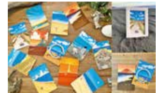
湘南・茅ヶ崎で描く、海を感じるイラストアート『湘南ランドスケープ：ポストカード』