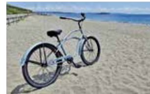
Mellowビーチクルーザー26