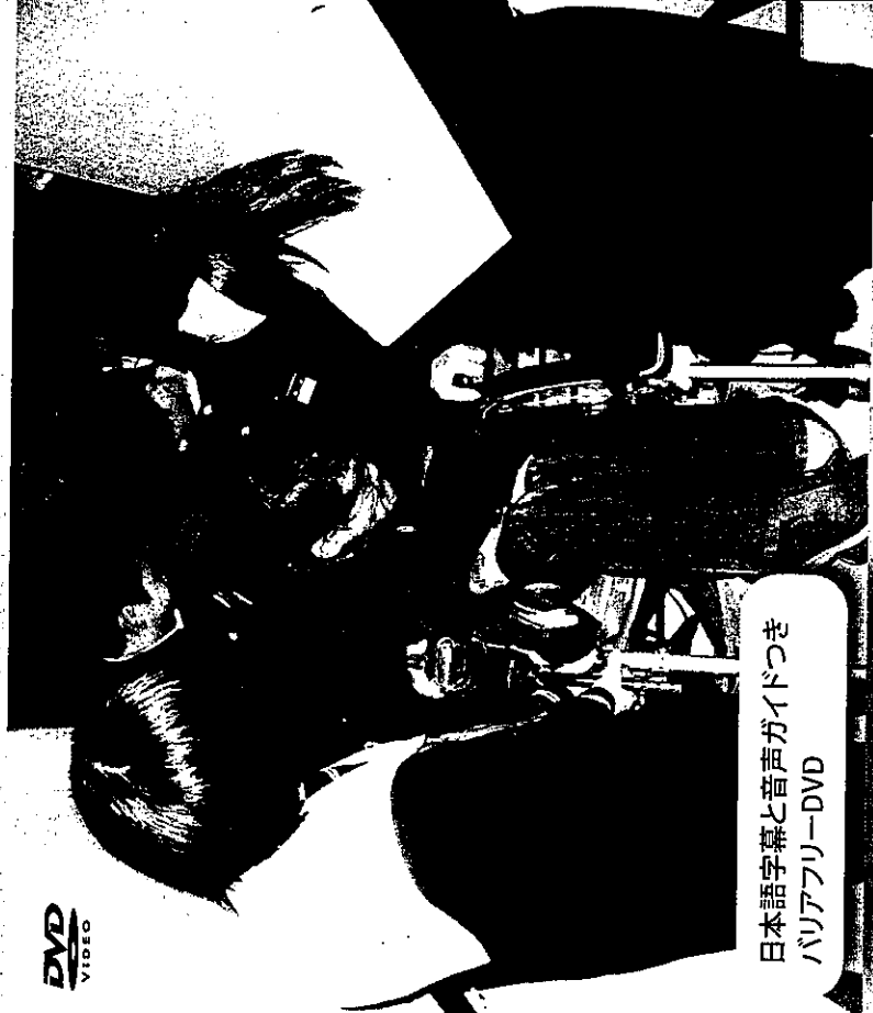
日本語字幕と音声ガイドつき バリアフリーDVD