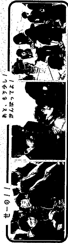
せーの!!! あと、もう少し! がんばってよ!