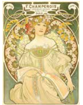
《夢想 シャンブノア》1897年 OGATAコレクション

ミュシャが描いた植物文様で彩られた優雅な女性像は、時代を超えて多くの人を魅了しています。本展では華麗なポスターや装飾パネルをはじめ、小さな切手や香水瓶など、多様な作品を展示しながらミュシャの生涯に迫ります。