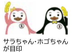
サラちゃん・ホゴちゃんが目印

「社会を明るくする運動」は罪を犯した人の立ち直りを支え、犯罪や非行のない明るい社会を築くために地域社会の理解と協力を求める、法務省主唱の全国的な運動です。7月は強調月間・再犯防止啓発月間です。