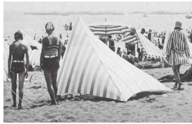
茅ヶ崎の名勝として発行された絵はがき

企画展では、それ以前の主に茅ヶ崎に海水浴場が開設された明治時代後期から、湘南独自の文化がどのような歩みをたどっていったのかを紹介します。