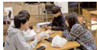
ティーラウンジでのおしゃべり

学生ならではの視点から、「学生だからこそできること」をモットーに活動しています。誰もが豊かな経験ができ、自分の居場所を感じられるような空間づくりを大切にしています。