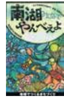
イベントポスター