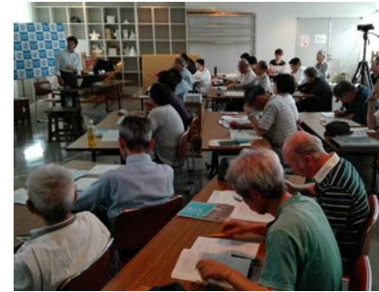
住まう茅ヶ崎について、ともに学ぶ受講生同士のつながりも人気の理由のひとつ。

大人気のちがさき丸ごとふるさと発見博物館講座（基礎編）、平成28年度秋期がいよいよ10月7日からはじまります。