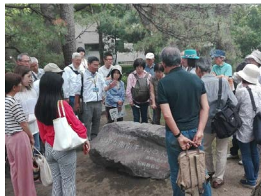
座学だけでなく、「ちがさき丸ごとふるさと発見博物館の会」のガイドによる、「まち歩き体験」もあります。

【お申し込み】 8月26日（金）から9月15日（木）までに茅ヶ崎市教育委員会社会教育課まで、電話にて（☎0467-82-1111）。先着順。