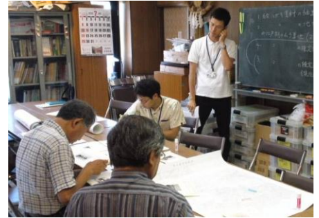
市民ボランティアとともに進める都市資源についての調査・研究。都市資源データベースの開発