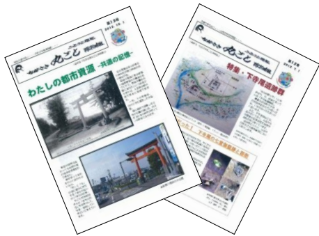
季刊誌(4、7、10、1月)の編集・発行。