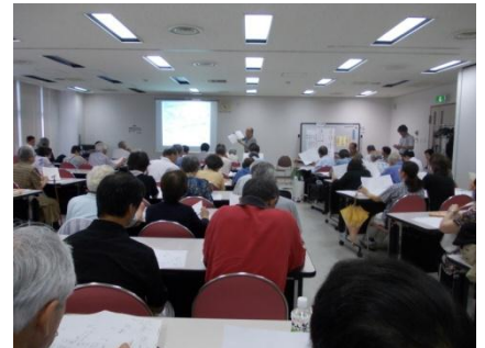
都市資源をテーマにした講演会等のイベント