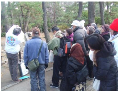
市民ボランティアによる都市資源をテーマにしたまち歩き等のガイド