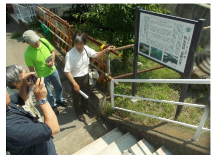
都市資源説明板・案内板の設置