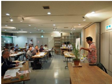
「茅ヶ崎を1から学ぶ」をテーマにした市民向け講座の開催(平成26年1~3月、6~9月)

平成18年4月に策定された「ちがさき丸ごとふるさと発見博物館事業の指針」に基づき、市民と行政協働のもと、「ふるさと茅ヶ崎」を愛する人を増やし、まちを生き生きとさせる、さまざまな事業を進めています。活動にご興味がある方は茅ヶ崎市教育委員会社会教育課までお問い合わせください。(TEL 0467-82-1111)