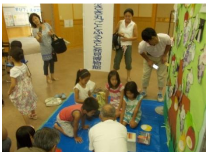
新しい都市資源、「共通の記憶」を発掘する事業