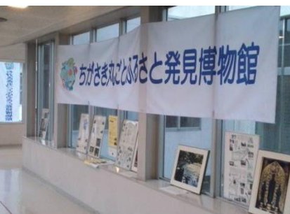
都市資源のパネル展示事業