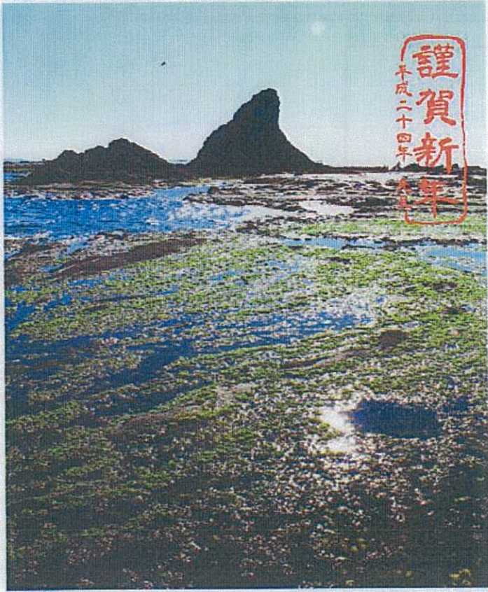
えぼし岩のアオサ田んぼ

みなさん、社寺に詣でられた際には龍を刻んだ欄間、手水石にこめられた様々な願いなどを発見しましょう。