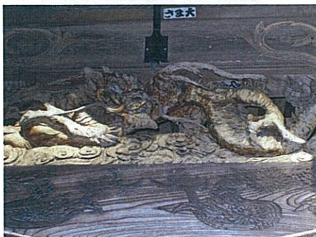
芹沢腰掛神社の欄間