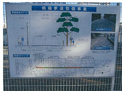
鶴嶺八幡宮参道整備事業の揭示板

行われています。かねてより周辺の人々を悩ませてきた雨水被害を解消するため、神社と地元と市が長期にわたり協議を重ね、あわせて下水道整備をはじめ、歩道のある明るい参道に生まれ変わりつつあります。残る南半分も工事中で、松並木の景観保持の工事を含めて平成24年度の完了が見込まれています。