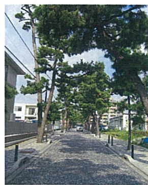
整備を終えた部分の参道

鎌倉の鶴岡八幡宮の参道のように、鶴嶺八幡宮も(当時の)海岸近くまで参道が続いていた可能性もあります。当時の地理や地域の歴史を偲びながら、県内有数の景観が残る松並木の参道をゆっくり歩いて参詣してみませんか。