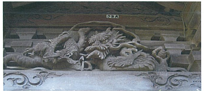
菱沼八王子神社の欄間