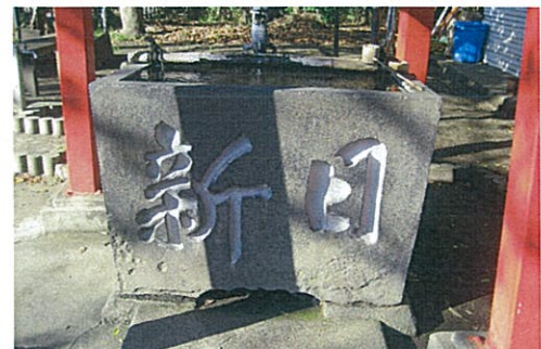
小和田熊野神社の手水石