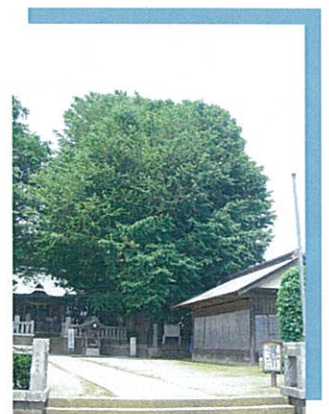
鶴嶺八幡宮の大銀杏

鶴嶺八幡宮の歴史 鶴嶺八幡宮は源頼朝から五代前の源頼義が平忠常の乱を平定した折りに、このあたりの懐島郷を通り、風光明媚な小丘に源氏の守り神である京都の石清水八幡宮を勧請したのに始まり、頼義の長子八幡太郎義家(1039年~1106年)が、父の応援に奥州へ向かう途中、そこに詣で、戦勝祈願して現在地に遷座したとも言われています。義家は境内に銀杏の木を手植えして勝利を祈りました。その銀杏と伝えられるものが神奈川県天然記念物に指定されている大銀杏(オオイチョウ)で、樹齢950年と推定され、今では樹高29m、周囲9mの大木となり、この神社や地域の象徴となっています。地元では鎌倉の鶴岡八幡宮の本社だとも言われています。