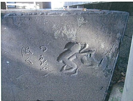
室田八王子神社の手水石 山岡鉄舟書による龍の刻銘