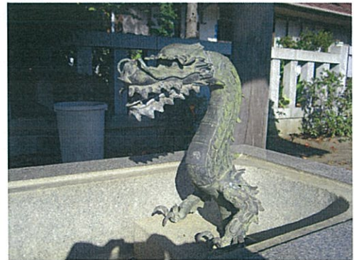
赤羽根神明大神社の手水石 龍を象った水口