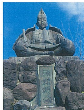
鎌倉市源氏山公園の頼朝像

のは鎌倉幕府を開いた源頼朝だと言われています。幕府成立前の治承5年(1181年)正月朔日(ついたち)に鎌倉の鶴岡若宮に参詣したのが始まりであるといわれています。(「日本の歴史 第5 躍動する中世」より)