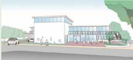
施設の完成イメージ

地域の主体的な活動の拠点となるよう、地域集会施設と地区ボランティアセンター、地域包括支援センターの複合施設を2026年10月の開館に向けて整備します。