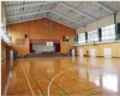
授業中や災害時などの熱中症を予防

授業中や学校行事中の熱中症を予防するため、小・中学校の体育館にエアコンを設置します。また、災害時に避難所として活用するため、発電機を設置し、停電時にもエアコンを稼働できるようにします。