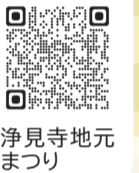
浄見寺地元まつり