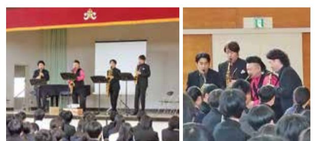
中学校で行ったサクソフォン・カルテットのコンサート。楽器などの解説を聞きながら鑑賞

アーティストや職人らが学校などを訪れ、子どもたちが文化芸術に触れる機会を創出。子どもたちの豊かな創造性や感受性を育みます。