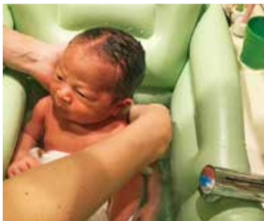
ヘルパーを上手に利用して、子育ての負担を軽減

産前・産後の心身の健康状態や育児に不安を抱える方に対して、家事・育児をサポートするヘルパーの利用を支援します。