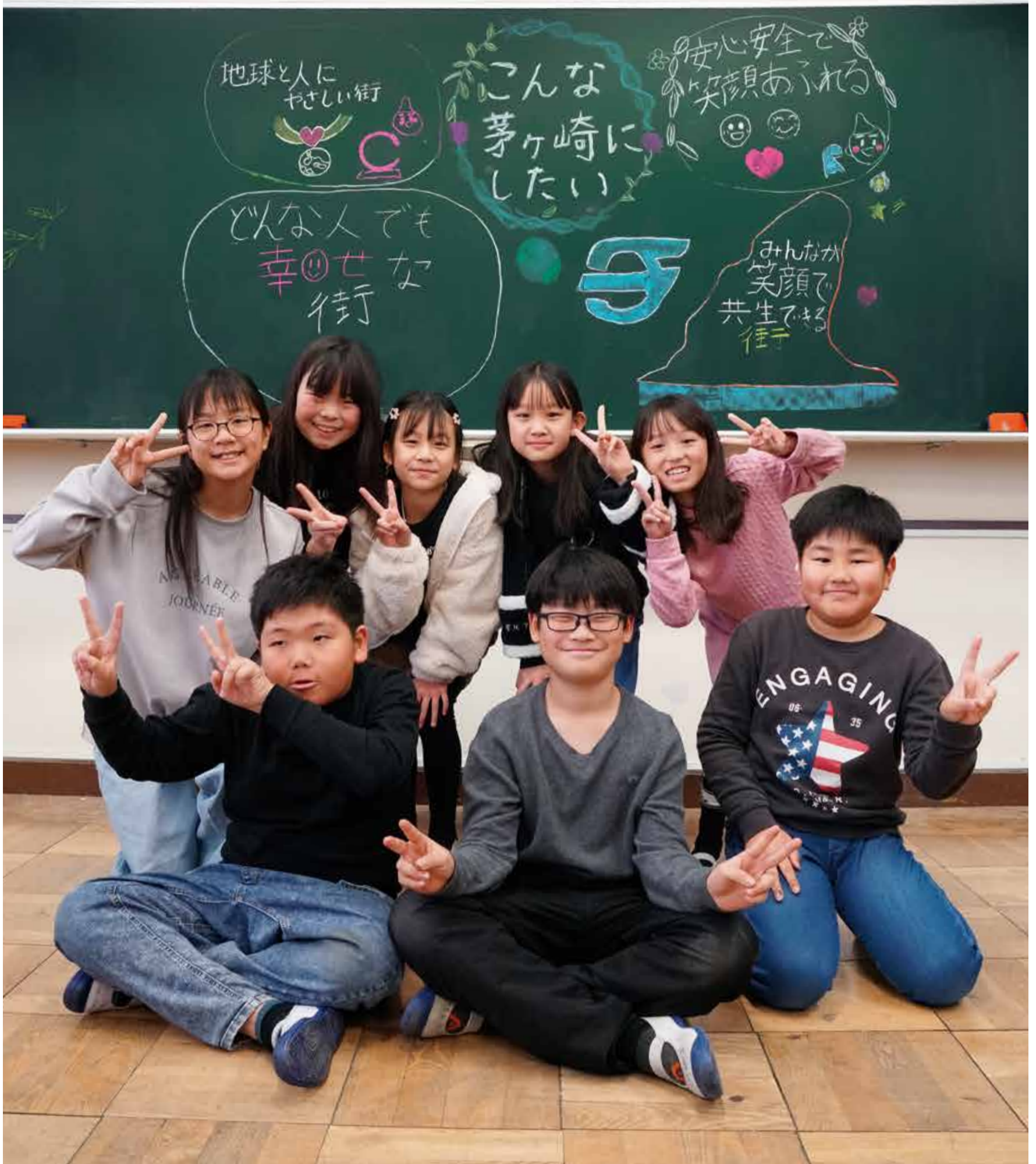
梅田小学校の児童たちに、自分たちが思い描く茅ヶ崎の未来を聞きました