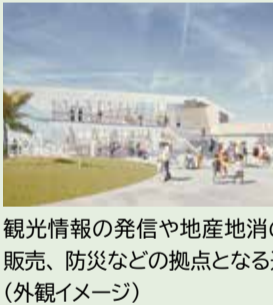
観光情報の発信や地産地消の販売、防災などの拠点となる。(外観イメージ)