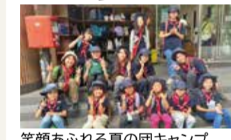
笑顔あふれる夏の団キャンプ

総勢20人が活動するガールスカウト第16団です。活動を通して、自身と他の人の幸福と平和のために考え、行動できるように育っていくことを目指しています。