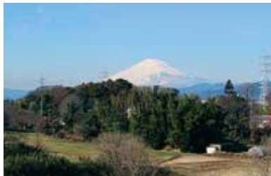
県立茅ヶ崎里山公園からの富士山

まちの景観と自然環境はとても密接な関係にあり、昔ながらの多様な自然環境がさまざまな景観をつくり、まちに潤いを与えています。例えば、常緑樹と落葉樹が混在する樹林地や草地、池や水田、湿地といった水辺環境などさまざま。街路樹やご家庭の生け垣、庭でも、木、草、池などの環境を整えることにより、四季折々の景観を楽しむことができます。自然環境を保全することが、茅ヶ崎らしい景観を守っていくことにもつながります。