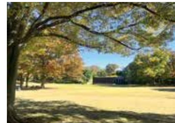
色づいた第一カッターきいろ公園(中央公園)