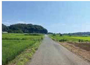
芹沢から行谷を望む田園風景