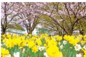
さむかわ中央公園のすいせん

今年度は、制定50周年を記念し、夏から土づくりを始め、10月下旬には多くの町民と球根の植え付けを行いました。3月には、桜が満開となるさむかわ中央公園や、多くの人が往来する寒川駅北口のロータリー、町立小・中学校の卒業式を計1万2千株のすいせんが彩ります。