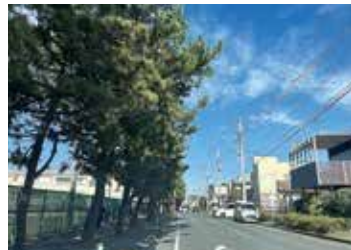
一中通りの松並木