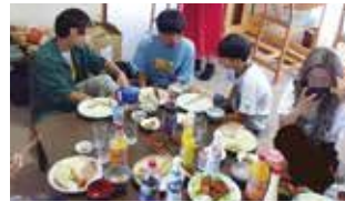
みんなでご飯を食べよう会

生きづらさを抱えた人々の問題の緩和に向け活動し、居場所づくりをしています。日々の生活の中でほっとひと息つきに来ませんか。