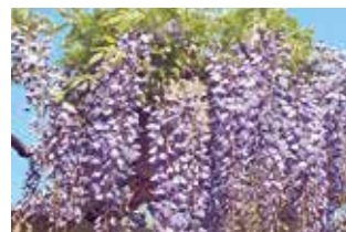
なかむら公園のフジ

フジロードのマップを掲載した「Fuji sawa 藤ガイド」は、藤沢市のホームページからダウンロードできます。さまざまなフジの花が楽しめるフジロードを散歩してみてください。