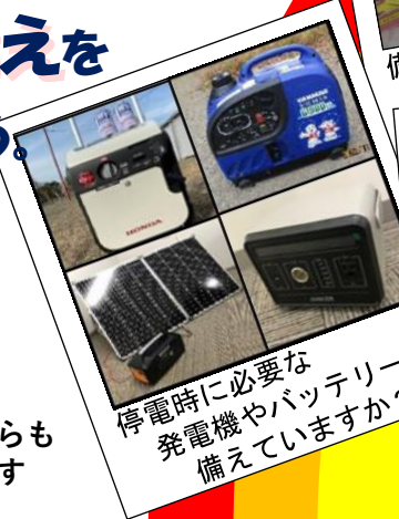
停電時に必要な 発電機やバッテリー 備えていますか？