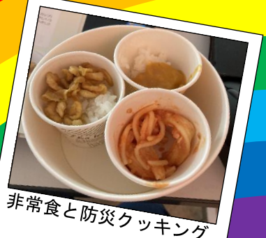
非常食と防災クッキング