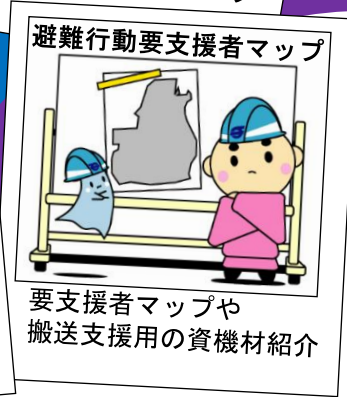
要支援者マップや 搬送支援用の資機材紹介