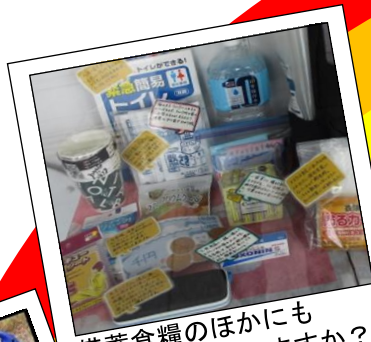
備蓄食糧のほかに も備えていますか？