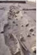
古代水田の水路跡

本村居村B遺跡発掘調査現地説明会 日時：11月11日(土)①10時30分～11時30分②13時30分～14時30分 ※荒天中止 場所：会場(本村4丁目) 内容：発掘現場の解説、出土品の展示 かながわの遺跡展 講演会 日時：2024年1月13日(土)14時～16時 場所：市役所分庁舎コミュニティホール 講師：井上和人(奈良文化財研究所名誉研究員) 定員：200人(申込制(抽選)) 申込：10月30日(月)～11月30日(木) 問合せ：県埋蔵文化財センター ☎045(252)8661