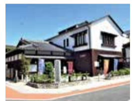
ふじさわ宿交流館

旧藤沢宿の一角には、「藤沢市ふじさわ宿交流館」があり、藤沢宿に関する歴史を学ぶことができます。ぜひ訪れてみませんか。