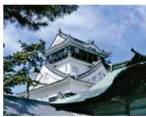
クロストークで登場する岡崎城