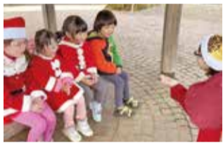
サンタの衣装でパーククリーン