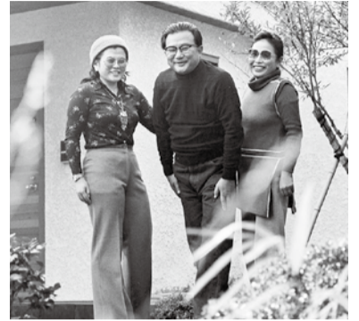
茅ヶ崎の自宅前で撮った家族写真

本企画展は、約30回にわたるこれまでの企画展で展示された収蔵品の中から、芥川賞受賞作「裸の王様」をはじめ、「ベトナム戦記」「輝ける闇」「夏の闇」「オーバ!」他、代表作の直筆原稿や取材資料、愛用品などの選りすぐりの品を展示。作家としての足跡をたどります。