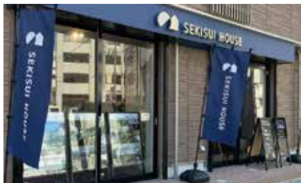
▲平塚市八重咲町3-26ガラス八重咲1階

積水ハウスでは平塚駅南口徒歩1分の平塚ギャラリーで無料の個別相談会を開催中。経験豊富な専門家が不動産や土地について様々なアドバイスをしてくれます。湘南エリアにある分譲地のご案内も可能。土地からお家にこだわって、より良い暮らしを送りませんか。