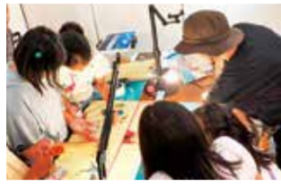
体験教室で楽しく作業

アニメーションを軸にアートで表現する楽しさを体験できる活動をしています。スマートフォンや家庭にある道具を使って、受け身ではなく、自分の考えを表現する場と機会を作ります。