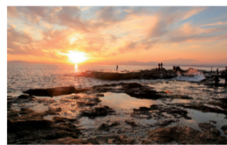
夕日に染まる稚児ヶ淵

れ、休日には多くの釣り人でにぎわっています。江の島に渡る橋「江の島弁天橋」と稚児ヶ淵は観光遊覧船で結ばれていて、天気の良い日には江の島や富士山を眺めながら、約6分間の船旅が楽しめます。美しい景色を眺めに稚児ヶ淵を訪れてみませんか。