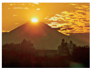
ダイヤモンド富士

川とのふれあい公園から見ることができる富士山は、「寒川宮山の富士」として「相模川八景」にも選ばれています。「相模川八景」とは、1986年、県民の投票をもとに、県と相模川沿岸に位置する市や町によって選定された眺望の美しい場所のことです。そして、秋口にはこの「寒川宮山の富士」を「ダイヤモンド富士」として写真に収めることができます。ダイヤモンド富士とは、富士山の頂に太陽が重なり合う瞬間、太陽がダイヤモンドのよう