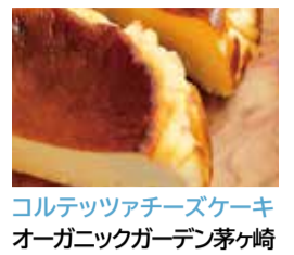
コレツツァチーズケーキ オーガニックガーデン茅ヶ崎