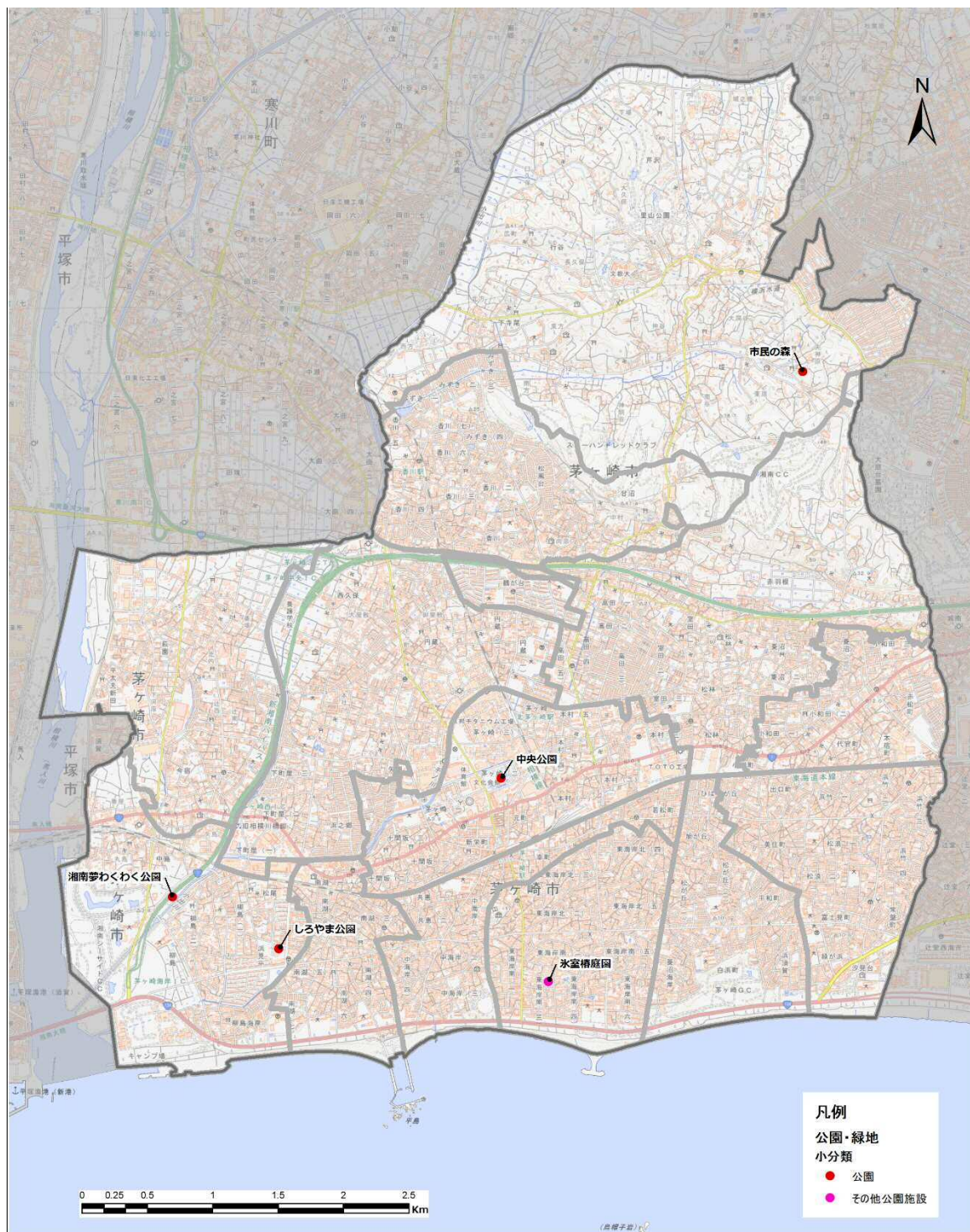
図 6-69 公園・緑地の施設配置状況