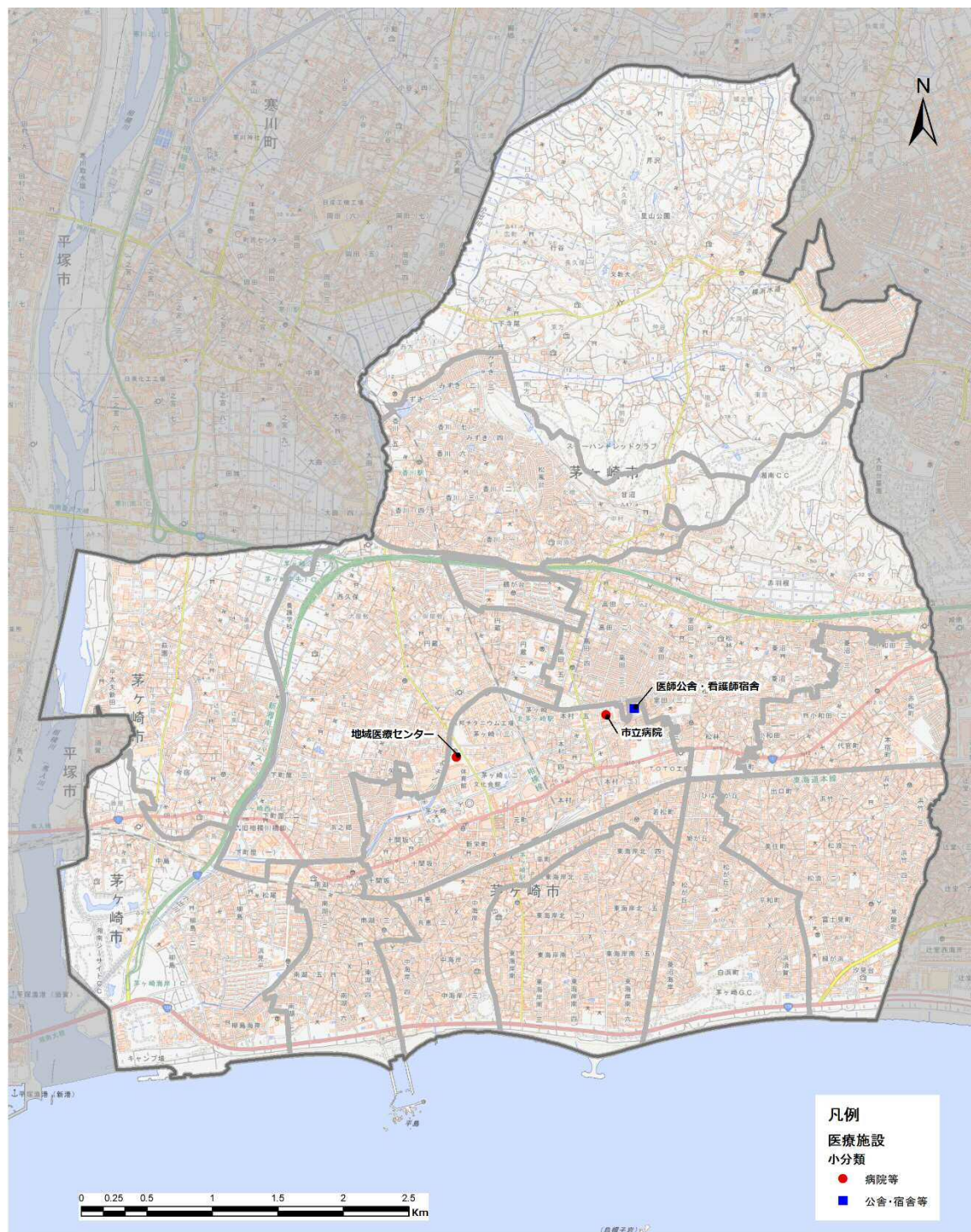
図 6-19 医療施設の施設配置状況