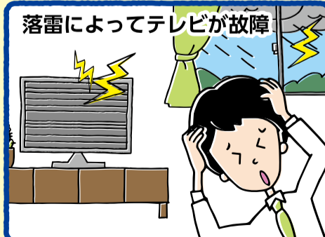
落雷によってテレビが故障