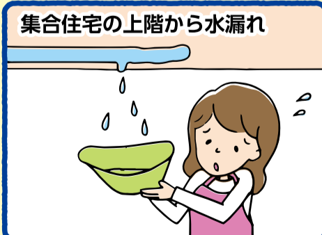
集合住宅の上階から水漏れ