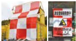
津波フラッグ(左)とタペストリー(右)

津波フラッグやタペストリーを見たら、すぐに海岸から離れ、高台や津波一時退避場所など高い所へ避難しましょう