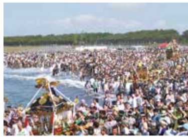
神輿が海に入るのは入場時とお発ちの頃

茅ヶ崎に夏の到来を告げる「浜降祭」が4年ぶりに開催されます。祭典は県の無形民俗文化財やかながわのまつり50選にも指定されています。夜明けとともに39基の相州神輿が浜に集まり、「どっこい、どっこい」という勇ましい掛け声の中、砂浜をところ狭しと乱舞する光景は壮観です。