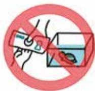
販売・購入・頒布