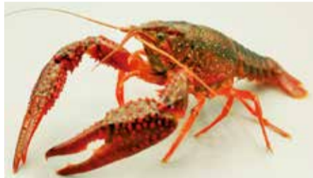
条件付特定外来生物になるアメリカザリガニ