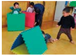
マットでトンネル遊び