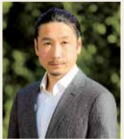
別府史之さん 茅ヶ崎市出身。北京・ロンドンオリンピック日本代表。ツールドフランス日本人初の完走者で、数々の国際レースでも活躍。プロ引退後、サイクリングの普及や啓発、育成などを行う。ちがさきヴェロフェスティバルにも協力

広告掲載のお申し込み・お問い合わせは広報シティプロモーション課 ☎(81)7123ハ