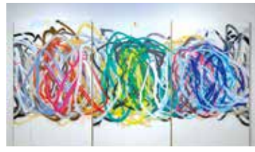
やんツー『Untitled Drawing by a Device for "Graffiti" #13 (seen the sea)』2022年

本展では子どもと大人とドローイングマシンが巨大な壁面に描いた迫力ある作品や茅ヶ崎に落ちていたごみで作られた作品の他、来館者などの声、美術史に残るゆかりある作家の作品などを展示します。美術館という空間で一人一人の時間を過ごしてみませんか。