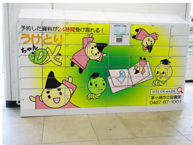
うけとりちゃんDX全景