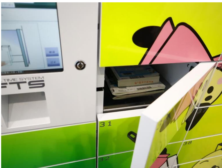
取り出す時の様子