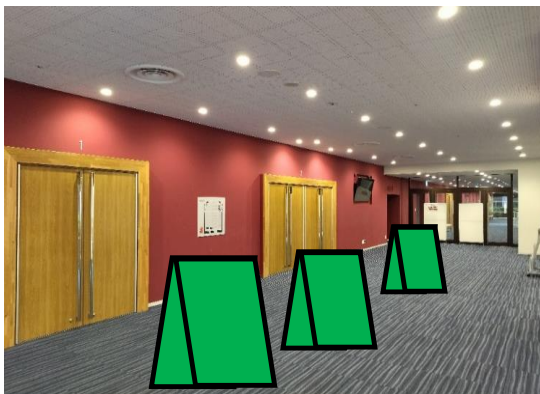
↑市民文化会館小ホールホワイエ