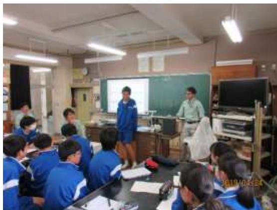
昨年の円蔵中学校への出前講座の様子（千の川水質調査）