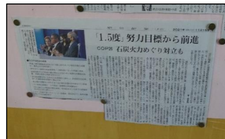
環境に関する新聞記事掲示

図書室の壁面には、図書委員が新聞記事を定期的に掲示しています。環境に関する記事もピックアップされており、現在の環境問題を学ぶ機会を提供しています。