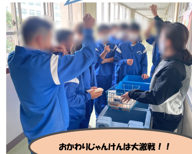
おかわりじゃんけんは大激戦！！