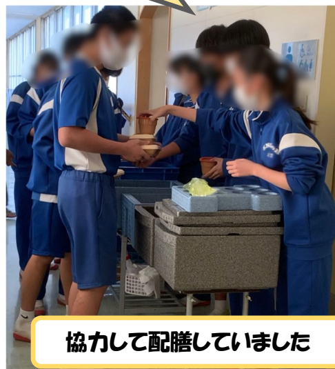
協力して配膳していました