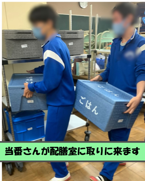
当番さんが配膳室に取りに来ます