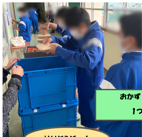
おかず・ごはん・汁ものの順に 1つずつ重ねて運びます