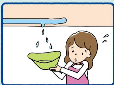
集合住宅の上階から水漏れ