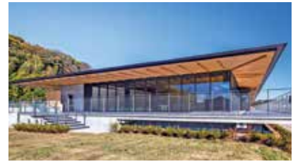
博物館の南側に駒寄川、西側に観察広場があり、自然観察会なども予定