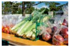
朝市に並ぶ旬の農産物

土曜日に、みなさんも白いトウモロコシや新鮮な野菜などを求めにぜひ足を運んでみてください。