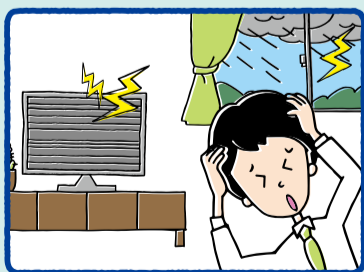
落雷によってテレビが故障