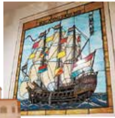
近代の別荘だった松籟荘の模型と、実際に飾られていたステンドグラス