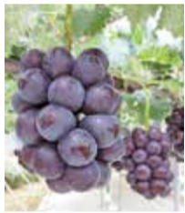
藤沢生まれの藤稜

藤沢生まれの品種もあり、その代表格が藤稜というぶどうです。藤沢の育種家が1985年に品種登録しました。一粒の大きさが500円玉と大粒で、現在では全国各地で栽培されています。藤沢では8月上旬から旬を迎えま