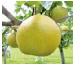
寒川町で生産されている幸水

め、甘みがのっているのが特徴です。寒川町で生産されている梨は種類が豊富で、8月中旬から旬を迎える幸水は生産量が一番多く大変人気があります。7月下旬から8月初旬までが旬のあけみずは果肉が柔らかく酸味が少なく、とてもジューシーでさっぱりとした味わいです。9月下旬頃までさまざまな種類の旬の梨をお楽しみいただけるので、湘南梨をぜひご賞味ください。