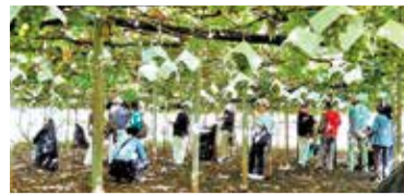
久しぶりの日帰り旅行でストレス発散

仲間と共に楽しむことを軸に、活動を通して会員同士の絆を深め、生き生きと過ごせるシニアライフを目指しています。また、社会貢献活動にも取り組んでいます。