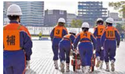
消防技術などを競う全国女性操法大会に出場