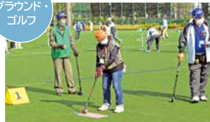
グラウンド・ ゴルフ

ねんりんピックかながわ2022を11月に開催します。市内ではグラウンド・ゴルフとサーフィン(ロングボード)の交流大会が行われ、全国から予選などを勝ち上がった選手が訪れます。また、会場では病気になる前に予防する未病改善教室などのイベントも開かれます。