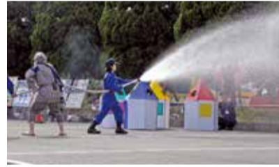
放水を披露(消防防災フェスティバル)