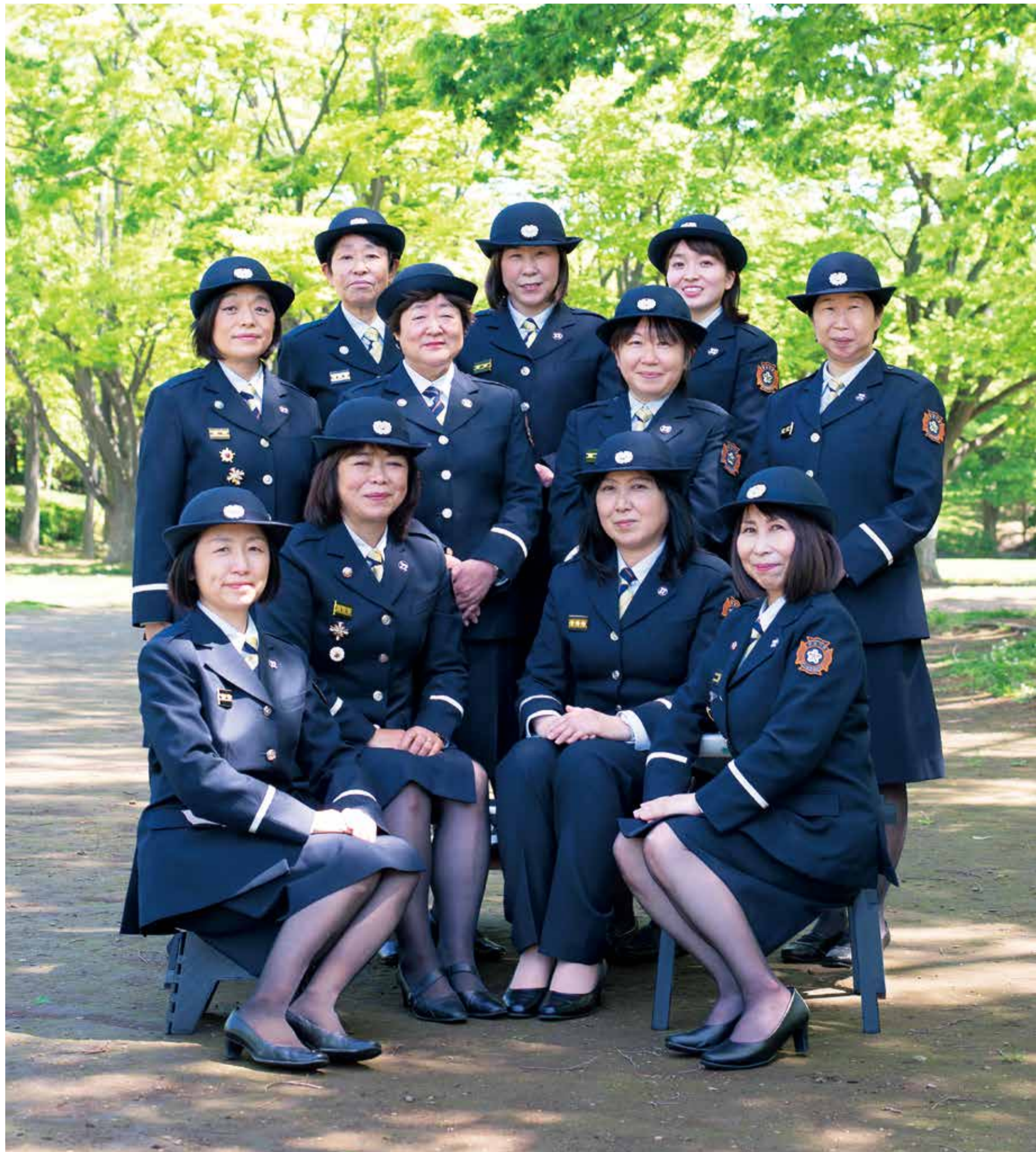
第17分団長と第22分団の消防団員 ※ 撮影のためマスクを外しています