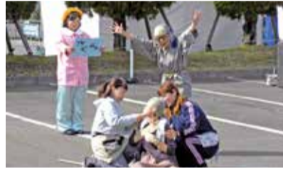
団員を募集する劇(消防防災フェスティバル)