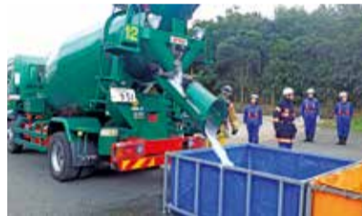
火災想定訓練(遠距離送水)