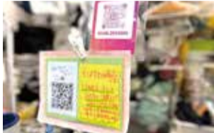
LINEやInstagram上で気軽に質問できるのも好評

子育ての役に立ちたいという思いから始まった松浪にある子ども用品のリユースショップBeansは、子ども服やおもちゃなどが充実しています。