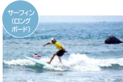
サーフィン (ロングボード)