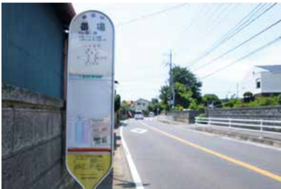
ライプイン茅ヶ崎に登場する番場のバス停

大学卒業後の1978年に、山側で農業を営む茅ヶ崎の若者たちの日常にスポットを当てた自主製作映画「ライプイン茅ヶ崎」を発表しました。茅ヶ崎で生まれ育った人とそうでない人との茅ヶ崎へのイメージの違いに気づき、「茅ヶ崎