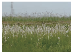
さまざまな生きものがすむチガヤの草地