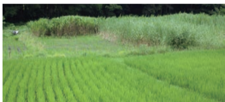
水田(手前)と休耕田(奥)の多様な環境が見られる行谷