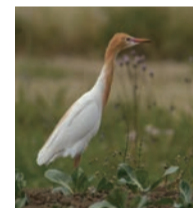
亜麻色の夏羽が美しいアマサギ

田んぼが多く残る行谷は、ツリフネソウやカトリヤンマなどの水辺や湿地でしか見ることができない生きものが多いです。4～6月にかけては茅ヶ崎の名前の由来にもなっているチガヤが白い綿毛をたっぷりと付けるため、風に揺れるきれいな景色を見ることができます。その他、4～5月にはアマサギやチュウサギなどの渡り鳥が南半球から飛来します。