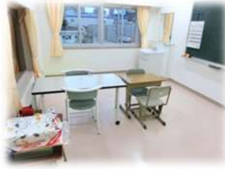
ことばの教室（梅田小学校）