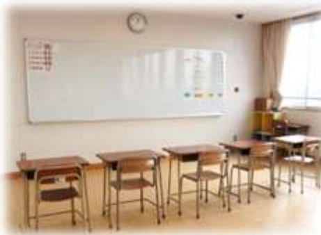
そだちの教室（鶴が台小学校）