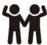
協働 = 協力して行動

「市民活動を行うものと市」による「協働」、 「市民と事業者」による「協働」、 「市民活動を行うものと事業者」による「協働」など組み合わせは様々ですが、共通の目的を達成するための手法の一つです。