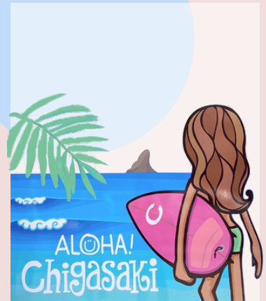
市観光協会事務所のウィンドウにガラスアートが。茅ヶ崎のシンボルえぼし岩を正面にサーフボードを抱える女の子の温かみのあるデザイン。 Designer:中根麻利さん