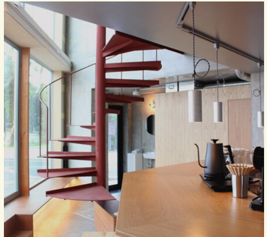
,COMMA Co-Working, Cafe and Bar

サザンビーチちがさきまで徒歩30秒。いつもの仕事場とは違うからこそ得られるひらめきや出会い。そこで変化を受け入れ、常にアップデートしていくことを恐れずに楽しめる。施設として首都圏近郊からのマイクロワーケーションを推奨。1Fはカフェ&バーで、こだわりのフードやドリンクを休憩に。