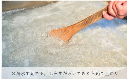
2 海水で茹でる。しらすが浮いてきたら茹で上がり