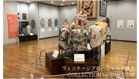
ウィンテージアロハシャツの魅力 COLLECTION by SUN SURF

地域にゆかりのある多彩な作家の作品を収蔵するほか、インクルーシブデザインの手法を取り入れた展覧会を開催するなど、豊かな地域発見に貢献したことが評価された注目の美術館。 美術館がある高砂緑地は四季を通して自然の豊かさが感じられ、ほっと一息できる場所です。