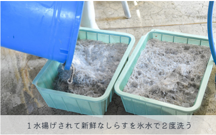
1 水揚げされて新鮮なしらすを氷水で2度洗う

茅ヶ崎のしらすを美味しく食べるには、生しらすの他に釜揚げしらすがおすすめ。釜揚げとは、獲れたての新鮮なしらすを大きな釜で塩ゆでにすること。茹でたては特に香り高く、ふわふわでとってもおいしい。