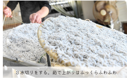
3 水切りをする。茹で上がりはふわふわ

4 素早く均等に平らに広げる。その後、天日干しをして完成。天気や湿度によって干し時間を調整。