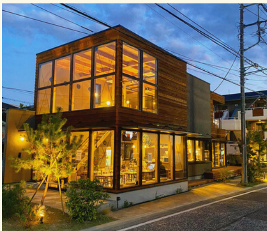
コワーキングスペース TakasunaBASE

茅ヶ崎駅より徒歩3分、海にも近い。サーフボードロッカーやシャワーの利用ができるサーファー向けのプランがあり、「海と暮らす街茅ヶ崎」の新しい拠点となっている。海好き・ちがさきで過ごす日常を味わい尽くしたい方にはピッタリ。