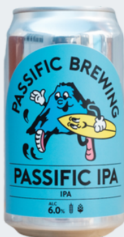
Passific IPA 6%

orderpassificbrewing@gmail.com 茅ヶ崎市萩園2644-3 お持ち帰り可(不定期営業日のみ) オンラインストアで缶ビールの販売がまもなく解禁に