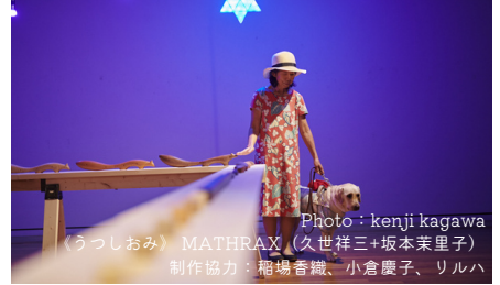
MATHRAX (久世祥三+坂本茉莉子) 制作協力: 稲場香織、小倉優子、リルハ