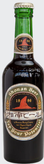
シユバルツ 5% ワールドピアカップ 金賞受賞歴あり

0467-52-6118/茅ヶ崎市香川7-10-7 オンラインストア有・お持ち帰り可