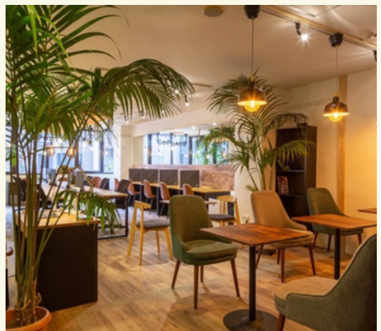
COPLACE Chigasaki コープレイス茅ヶ崎

茅ヶ崎駅より徒歩30秒。仕事以外にも会議、商談などその使い方は多種多様。職場・自宅以外の「第三の居場所」として、それぞれの生活にあった働き方を支えるような場所を提供。店内で味わえる、最高級のスペシャルティーコーヒーは格別。