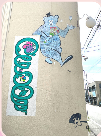
東海岸北2丁目にあるお花屋さん「ewalu」の壁画。 市内の至るところにRyu Ambeさんの壁画アートが！ 見つけたあなたはきっとほっこりするはず。 Designer: Ryu Ambeさん

街中を歩いていると、個性あるアートがあちらこちらに見つけることができます。茅ヶ崎らしいイラストは、街をちょっと明るくしてくれたり、見た人を笑顔にしてくれたりします。 街中アートを探しに散歩してみてください？