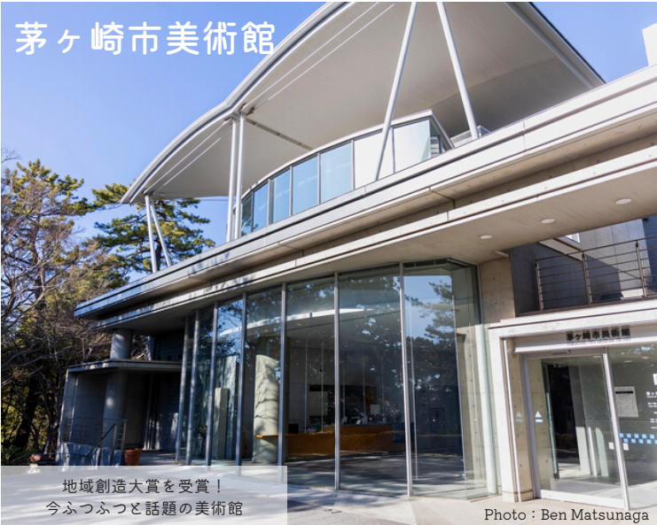
地域創造大賞を受賞！ 今ふつふつと話題の美術館