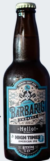
HIGH TIMES (American IPA) 6%

0467-67-7916 茅ヶ崎市幸町23-21 プリーゼ茅ヶ崎 1F オンラインストア有・お持ち帰り可