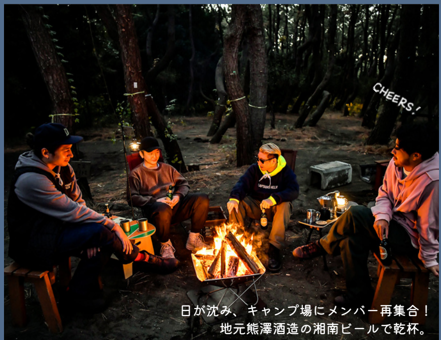
日が沈み、キャンプ場にメンバー再集合！ 地元熊澤酒造の湘南ビールで乾杯。