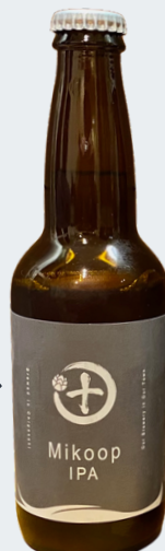
Mikoop IPA 7%

050-3748-0429 茅ヶ崎市美住町2-3 シャルム湘南店舗102号室 お持ち帰り可