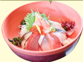
かつとび丼(海鮮丼) ¥1,430