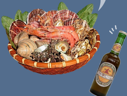
湘南ビールは売店で販売

海鮮WAKU・WAKU食材セットは海辺のキャンプ場ならではの。地元の魚屋さん直送の為、さざえなどの魚介は新鮮！このセットは3日前までに電話予約を。