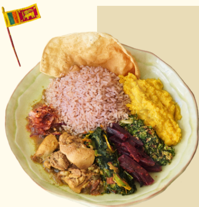
秘伝のスリランカカレー ¥1,350

看板メニューの「秘伝のスリランカカレー」が人気。小麦粉を使わないスパイス豊かなさらっとしたカレーは、本場スリランカの味を再現している。ご飯は、パスマティライス、国産玄米、スリランカ産赤米の3種類からチョイス。地元でとれた旬野菜を多く使った日替わりのおかずと一緒にワンプレートに盛りられる。カラフルさと華やかさ、具材の豊富さは、目にも舌にも楽しい。ご飯とおかずを混ぜていくことでスパイスの豊かな味わいをより楽しめる一皿。