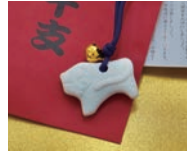
鈴付き干支のお守り