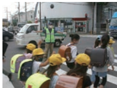
交通安全啓発活動

協議会は自治会や地区社会福祉協議会、青少年育成推進協議会、PTAなどの各分野の地域団体や公募委員で構成され、地域の活動、課題の発見、解決に向けたさまざまな取り組みが行われています。