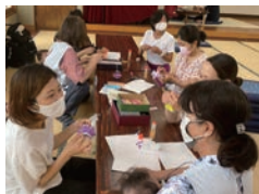
親子で季節の作品づくり