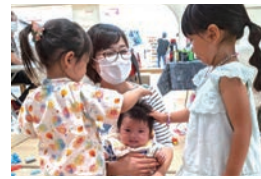
子ども同士の交流の場にも

ママほぐは、お母さんの居場所づくりと産後ケアなどを行っています。核家族化などによってお母さんに立ちのぼる孤独な「孤育て」をなくすこと、安心して子育てできるまちになることを目指して活動しています。