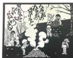
講師の切り絵作品