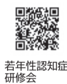
若年性認知症研修会