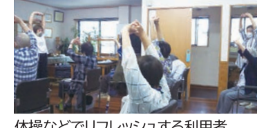
体操などでリフレッシュする利用者