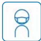
ご来場時のマスク着用