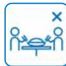
黙食・個食・マスク飲食