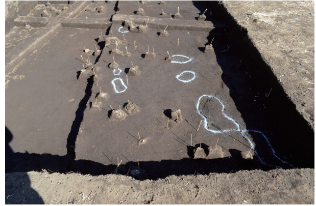
ブロック状の硬化面確認状況（西から）