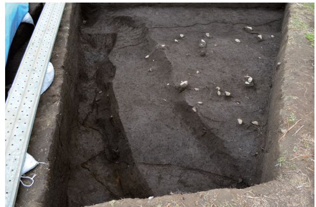
2号溝状遺構確認初期の状況（東から）