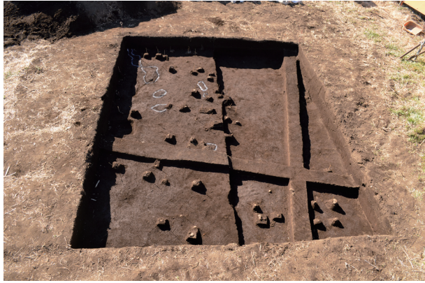
ブロック状の硬化面確認状況（東から）