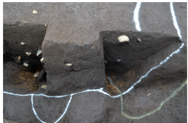
2号溝状遺構サブトレンチベルト東側遺物出土状況 （南から）