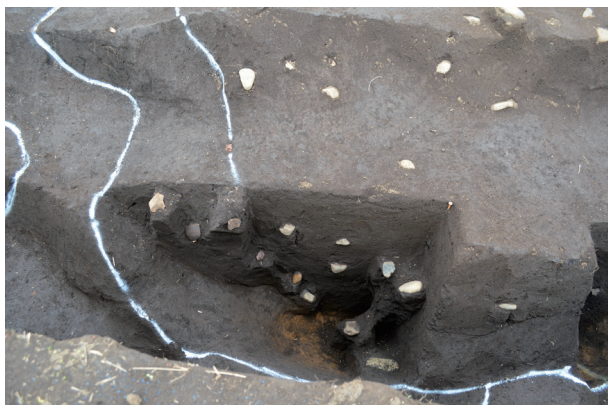
2号溝状遺構サブトレンチベルト西側遺物出土状況 （南から）