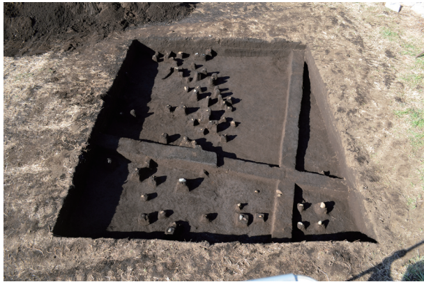
礫出土状況（東から）