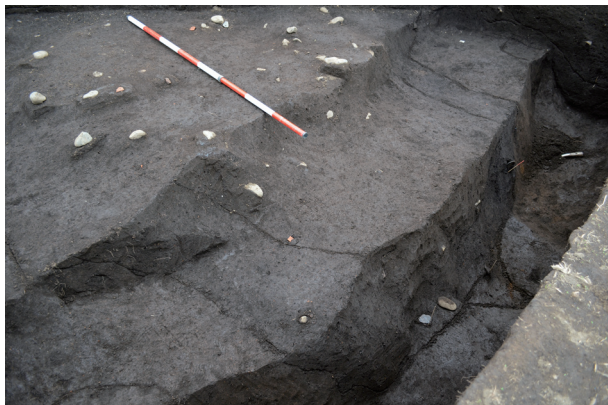
2号溝状遺構確認初期の状況（南西から）