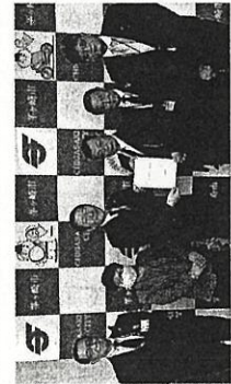
佐藤市長へ予算・政策要望書を提出