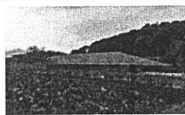
建設が進む交流館(市内堤地区)

【1】(仮称)茅ヶ崎市歴史文化交流館建設のために市が市民から取得した用地から、工事開始後に石綿含有スレート、アスファルトガラ等が発見され、それら障害物を処分する費用について、当該売主(市民5名)に対し損害賠償請求(総額約2億1千万円)を行うための訴訟を提起する議案ですが、今後同様の公共用地取得に与える影響等を勘案し、まずは交渉による円満解決を図るべきとの立場から反対しました。(訴訟関連費用を含む補正予算案にも反対)