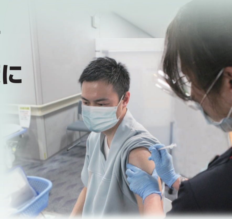
保健所管内では3月中旬から医療従事者への新型コロナワクチン接種を開始