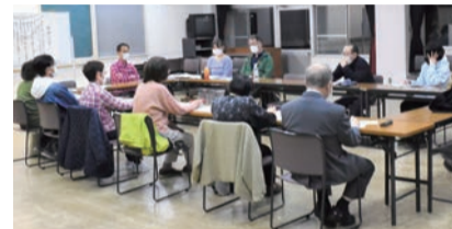
例会ではそれぞれの体験談を共有

会員が「断酒継続1年表彰」を受けたとき、本人と一緒に喜びを分かち合えることがやりがいです。秘密は厳守しますので、お気軽にご相談、ご参加ください。