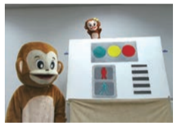
交通安全マスコットのモン太くんが解説

市では交通安全の意識向上を目的に、幼児や小・中学生、大人向けにそれぞれ交通安全教育の動画を作成しています。4月5日(月)から動画配信とDVDの貸し出しを開始します。交通安全の再確認として地域や市民団体などで活用しませんか。 【安全対策課安全対策担当】