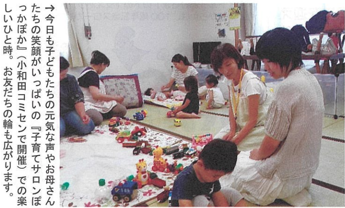
→今日も子どもたちの元気な声やお母さんたちの笑顔がいつぱいの『子育てサロンほっかほか』(小和田コミセンで開催)での楽しいひと時。お友だちの輪も広がります。

茅ヶ崎市には各地区2名ずつ、計26名の主任児童委員がいて、子どもや子育てに関する支援を専門に担当しています。地域の子どもたちや子育て中の方と顔見知りになり、困った時に気軽に声をかけていただけるように、登下校見守りや子育てサロン