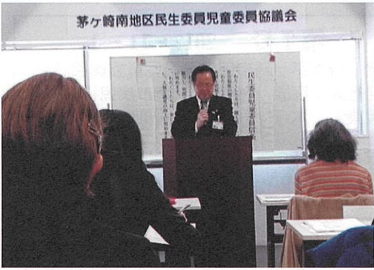
↑記念すべき第1回茅ヶ崎南地区民児協定例会(4/4)でお祝いのことを述べられる服部市長。

茅ヶ崎南地区は、茅ヶ崎地区の東海道線以南の5自治会(若松町幸・幸町・共恵海岸通り・共恵中央・共恵東)と海岸地区の中海岸自治会の6自治会により再編成が行われ、新たな地域コミュニティとして誕生しました。従来の縦割りの構造から、自治会、防災、地区社協、そして私たち地区民児協等の組織が横に並び、協力し合っ